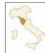
Betti Merlot (a) FATTORIA BETTI | TOSKANATraube 100% Merlot

Brillantes Rubinrot. Intensives Aroma, mit Noten von Himbeere, Unterholz und Pflaumenkonfitüre. Am Gaumen bietet er feine Tannine und erfrischende Aromen