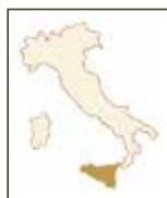
Terre della Baronia' Bianco Milazzo (a) MILAZZO | SIZILIEN 100% Catarratto

In der Farbe leicht gelb mit grünlichen Reflexen. Im Aroma blumigen Noten von Ginster, weißer Pfirsichen, Grapefruit und Apfel mit schönen Kräuternoten.