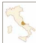
Gianni Masciarelli Montepulciano d'Abruzzo DOC (a) MASCIARELLI |

ABRUZZEN 100% Montepulciano Ein intensives und lebendiges Bouquet, mit Noten von Kirsche und schwarzer Johannisbeere, Veilchen und Tabak.