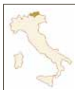
Weißburgunder DOC (a) TERLAN | SÜDTIROL Weißburgunder

Ein sortentypische Bouquet mit Aromen von reifen Äpfeln und Birnen. Weich, voll und äußerst harmonisch im Geschmack, verwöhnt er mit einem lang anhaltenden Abgang.