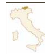
Pinot Grigio DOC (a) TERLAN | SÜDTIROL Pinot Grigio

Das fruchtige Bouquet erinnert an Williamsbirne, Litschi und weiße Melone. Fein ausbalancierte Geschmackskomponenten. Am Gaumen füllig und weich.