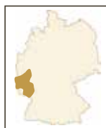
Sauvignon Blanc MP (a) MARKUS PFAFFMANN | PFALZ Sauvignon Blanc

Intensive Nase mit hellen Blüten, herber Grapefruit, leichter Orangeadenote, etwas Kiwi, aber auch Pfirsich, getrocknete Baumrinde, angetrocknete Kräuter, etwas Butter und frisch gemähtes Gras im Hintergrund.