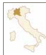
Lugana Citari (a) CITARI | LOMBARDEI 100% Trebbiano di Lugana

Diesen Wein zeichnen Leichtigkeit, Frische, ein Hauch von Blüten- und Pfirsich-Aromen aus.