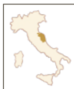
Rosé Marche IGT Rosato (a) VELENOSI | MARKEN 100% Montepulciano

Dieser herrlich frische Rosato erobert die Nase mit zarten blumigen Noten von Rosen und Veilchen und entwickelt alsdann einen ausgeprägteren Duft nach Johannisbeeren und Himbeeren.